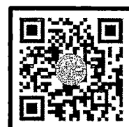
QR-Code ลงทะเบียนอบรม

ผู้อำนวยการสำนักงานบริการวิชาการ ปฏิบัติการแทนอธิการบดีมหาวิทยาลัยศิลปากร